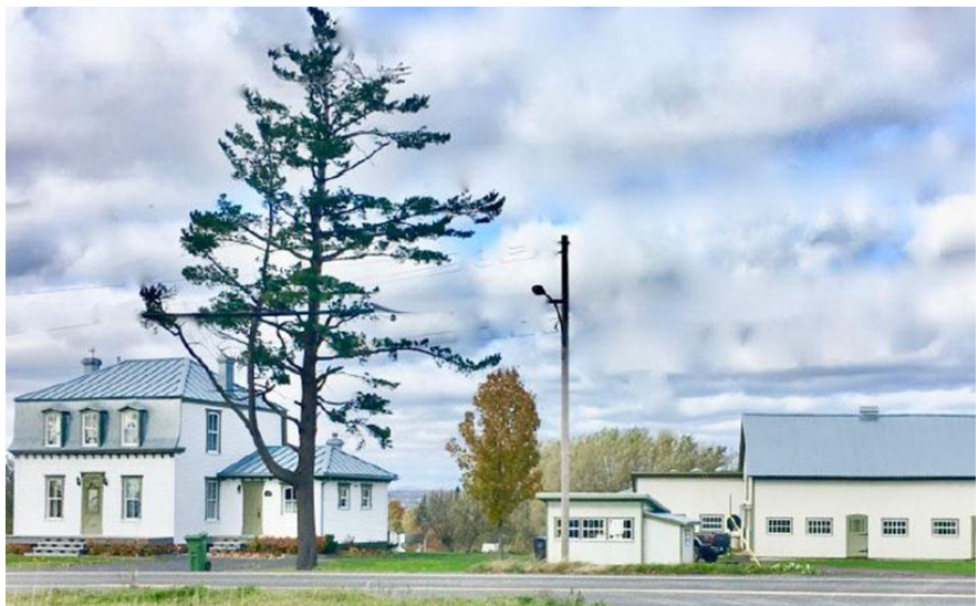
La ferme ancestrale des Fréchette, site web des prix du Patrimoine.