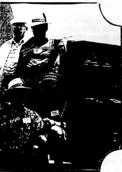
ique-nique à lle, le 7 juillet 1991