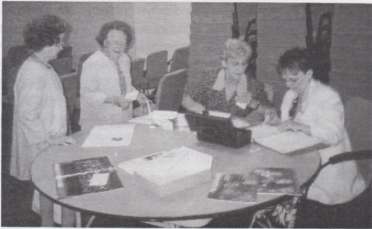
Vérification de l'inscription à l'arrivée