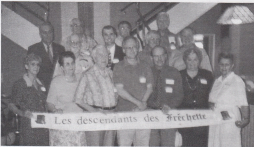
Conseil d'administration 2001-2002