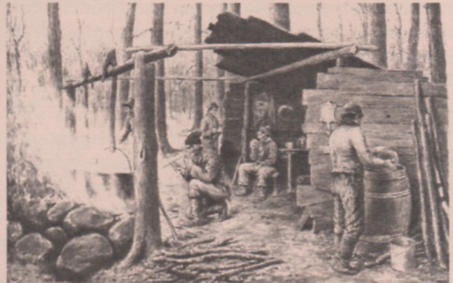
La cabane à sucre d'autrefois, d'après un dessin du dessinateur Edmond-J. Massicotte.

Le travail consistait d'abord à entailler les troncs au moyen d'une vrille, à la hauteur de trois pieds environ. Puis on y introduisait soit une lame de couteau, un morceau de bois taillé ou encore, un peu plus tard, un chalumeau sous lequel on installait un seau. Comme dans une seule journée,