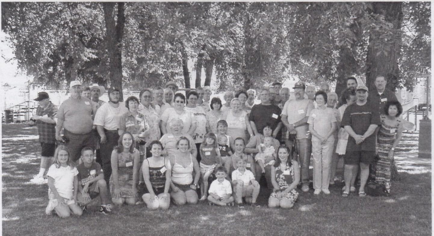
Photo prise le 11 juillet 2001 à Ellensburg, État de Washington, où se sont réunies des familles Frichette du Minnesota, de la Californie, de l'Orégon, de l'Arizona, du Colorado et de l'État de Washington. Autre réunion prévue pour 2003.

Voir le texte déjà publié sur les descendants de Stephen et Emma Baker, La Voix Des Fréchette, volume 8, numéro 2, décembre 1998.