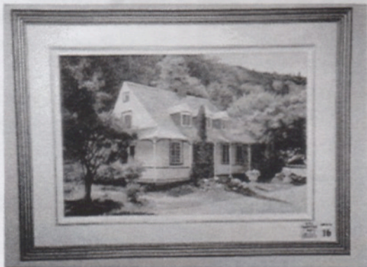
Un des toiles du concours : Maison Louis-Fréchette de Lévis

De façon plus détaillée, on apprend sur le site internet de la Corporation 1 ( http://www.total.net/~francbil/frechette.html ) qu'elle s'est donnée comme objet de :