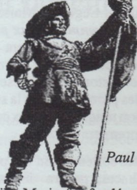
Paul de Chomedey de Maisonneuve