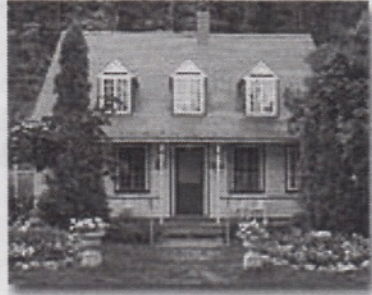
Jean-Claude Germain Maison Louis-Fréchette de Lévis