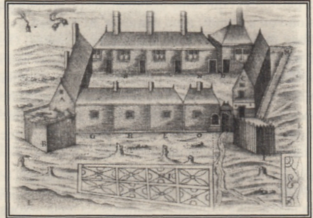
Source internet: L'habitation de Port-Royal Patrimoine militaire canadien

L'interaction entre les Européens et les Amérindiens s'avère déterminante pour les deux groupes. L'expertise des Amérindiens permet aux premiers Européens de survivre sur un territoire au climat et aux ressources différentes. L'évangélisation des Premières Nations rapproche ces dernières des Européens sans pour autant les rendre serviles. La rivalité de la colonisation anglaise au sud se fait sentir moins de dix ans après la fondation de l'Acadie; l'attaque de 1613 marque la première d'une série d'intrusions qui ponctuent la vie d'un territoire coincé entre la Nouvelle-France au nord et les colonies américaines au sud.