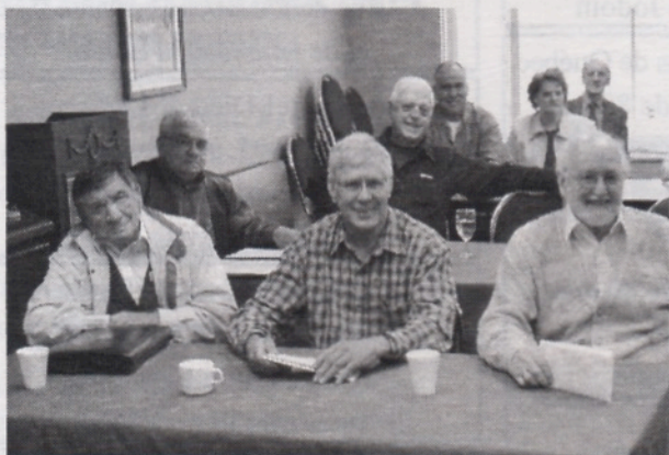
Quelques membres du C.A. 2005-2006

Au cours des réunions de notre Conseil cette année, tenues à Lévis, à Saint-Félix-de-Valois et à Terrebonne (réunion combinée avec notre dîner annuel du temps des Fêtes), nous avons tenté d'assurer la bonne marche de nos diverses activités. Nos grands projets pour l'année furent la préparation d'une réédition de notre dictionnaire généalogique et celle de notre récent rassemblement. Pour ma part, j'ai représenté vos intérêts au conseil de la Fédération des familles-souches du Québec à titre de premier vice-président, un mandat de 5 ans qui s'est terminé en mai dernier au dernier Congrès de la FFSQ à Valleyfield. En février 2005, j'ai assisté la FFSQ à son kiosque du Salon de généalogie et d'histoire familiale de Place Laurier. →