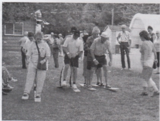
Participants au «ski sur gazon»