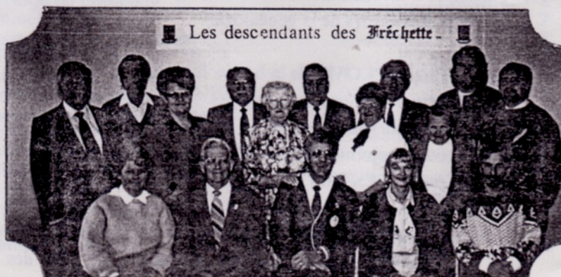
Conseil d'administration 92-93 ( Voir liste dernière page )

Tirée du BRH, no 34, Lévis 1928, p. 175-176