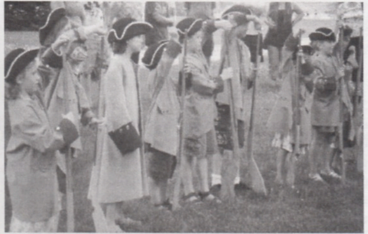
Fort-Chambly - Les jeunes en costumes d'époque

Après le repas, les participants se sont dirigés vers le Fort Chambly, lieu historique sur le bord des rapides de la rivière Richelieu par cette belle journée de juillet. Des explications furent données par un membre du service d'accueil du Fort, qui dura environ 20 minutes relatant les étapes historiques du Fort Chambly, puis les membres ont visité le Fort. Ils ont apprécié les manœuvres des membres de la compagnie Franche de la Marine, ainsi que l'essai des costumes d'époque que certains ont trouvé lourds et piquants, car le tout était fabriqué avec du lin et porté aussi bien en hiver qu'en été.