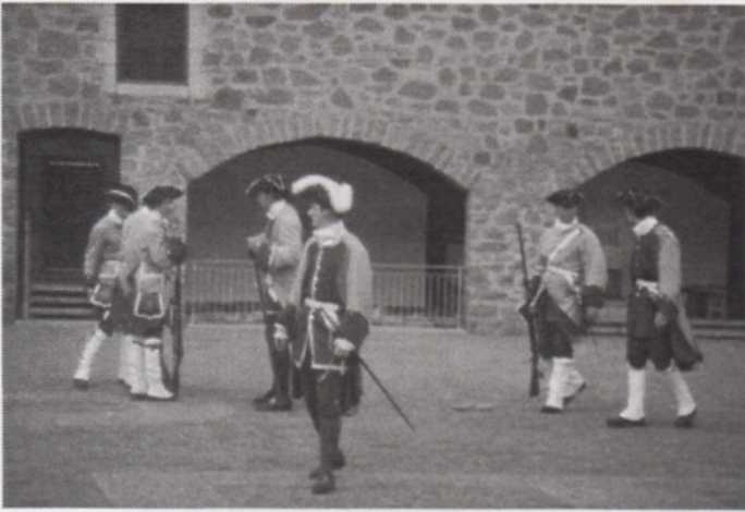
Fort Chambly - Manoeuvres militaires