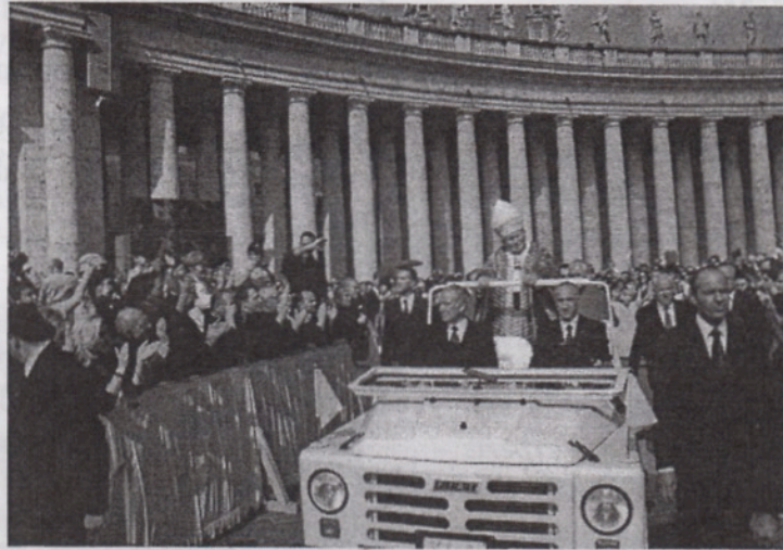
ROME - Jean-Paul II parmi la foule