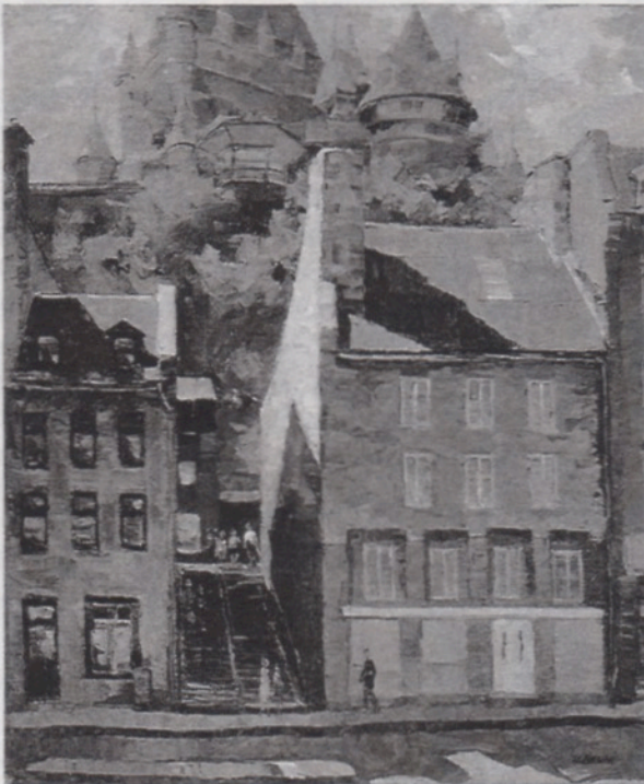
Maison que François aurait habité à Québec durant plusieurs années rue De-Meules, maintenant rue Champlain.