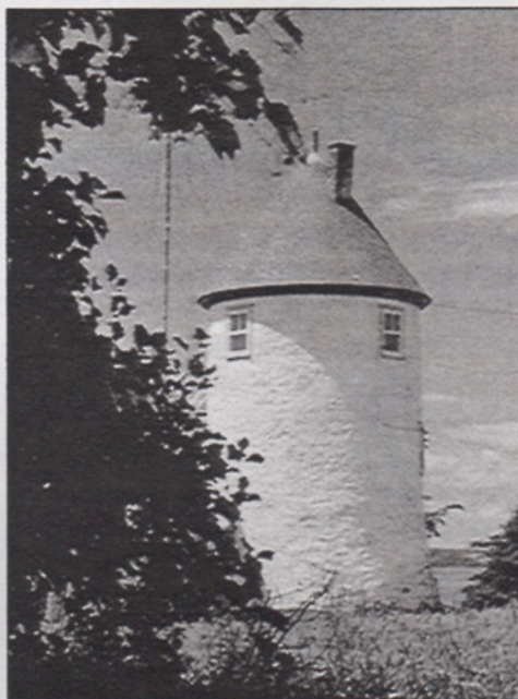
Moulin seigneurial de la fin du XVII e siècle