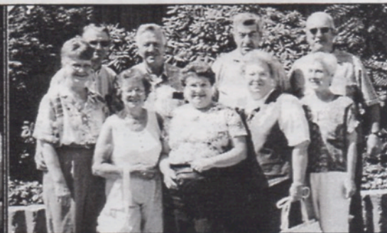
Groupe des Fréchette en voyage

Le voyage était du 31 mai au 15 juin 1996. Nous avons commencé le voyage en touristes, de Nice on a parcouru le sud de la France, en allant vers l'ouest avant de remonter vers le nord en longeant la côte Atlantique. Nous avons fait le tour de l'île de Ré. Le 7 juin était la journée de la rencontre avec les cousins Fréchet de France. La ville et l'office du touriste de St-Martin de Ré nous ont souhaité la bienvenue sur la terrasse du Gallion. Une vingtaine de Fréchet de France sont venus nous rencontrer. On a passé de bons moments à parler et à échanger les adresses avant de se séparer. L'aïeule de 91ans, s'est dérangée et a fait un bon trajet pour nous rencontrer. Il y avait aussi de jeunes couples.