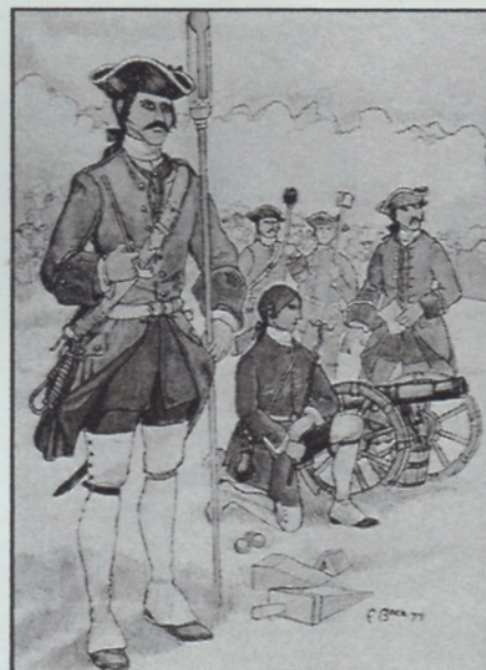
Reconstitution artistique d'un uniforme des militaires de l'époque