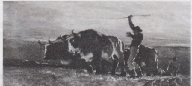
Labourage à l'aube