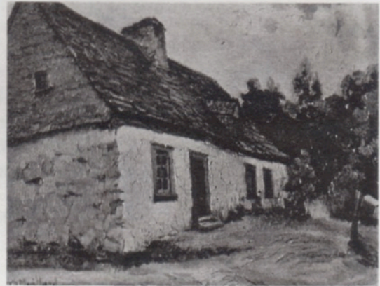
La maison Drouin à l'Île d'Orléans