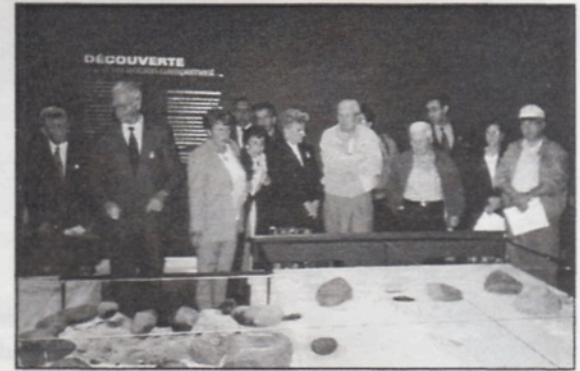
Au Musée, un groupe de Fréchette explore le passé à l'exposition permanente d'archéologie.