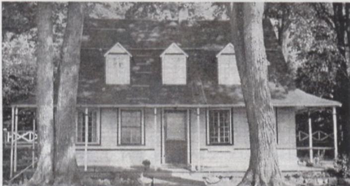
La maison Fréchette à Hadlow Cove