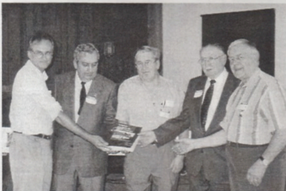
Lancement par les généalogistes du Dictionnaire généalogique des Fréchette d'Amérique.

Merci aux six généalogistes qui ont permis la réalisation de ce magnifique travail.