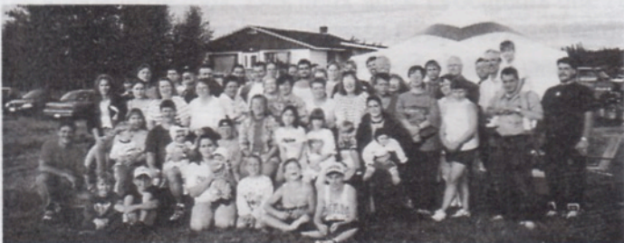
Les Fréchette de Hearst en fête