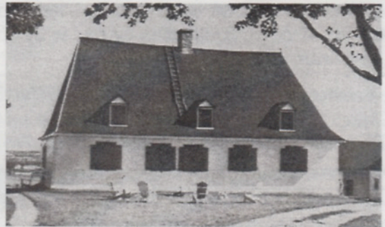
La maison Auclair-L'Heureux voisine du Moulin des Mères

A défaut des moulins, on peut visiter une construction qui existait déjà à cette époque et qui existe encore. Il s'agit de la maison Auclair-L'Heureux, dans laquelle je suis né. Elle est située au 1695, boulevard Saint-Joseph. Cette maison a été construite par Pierre Auclair, l'ancêtre, avec son frère André, de tous les Auclair d'Amérique. Une analyse dendrochronologique (âge du bois) atteste que certaines de ses poutres datent de 1673. Dans sa forme actuelle, la maison date de 1719.