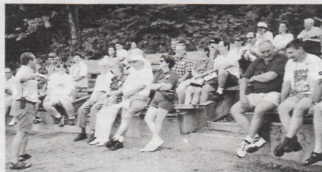
Moment de repos apprécié après la descente à la "fontaine du diable"

Merci à tous les participants(es). Félicitations aux heureux gagnants de la journée. Au revoir et à l'an prochain.