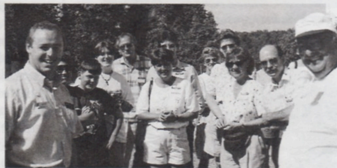
Le groupe des Fréchette au départ de la visite

On aura du plaisir à revoir les différents moments de cette journée, captés sur pellicules par Yvon, le photographe. Estelle saura nous les présenter lors de prochaines réunions dans des albums souvenirs.