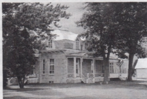
Presbytère de Batiscan construit par Wenceslas Fréchette

En collaboration, Histoire de la paroisse Saint-François-Xavier de Batiscan, 1684-1984, Éditions du bien public, 1984.