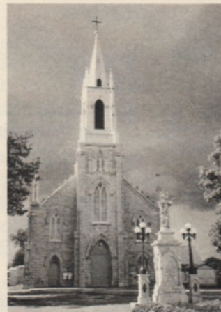
Eglise de Batiscan