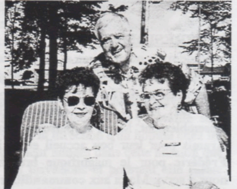
Un moment de détente