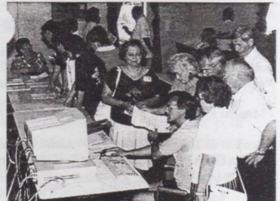
Guy à l'ordinateur