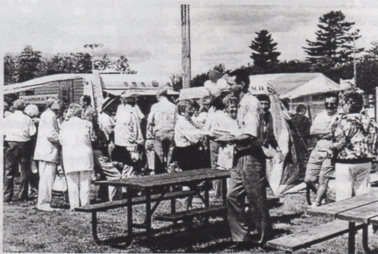
La joie des retrouvailles

Ce fut une fête bien réussie grâce à toutes ces personnes qui se sont impliquées et Dame température nous a également favorisés. En plein Festival du Folklore, réunir près de 400 personnes à notre rassemblement fut un très beau succès : merci à tous les participants.