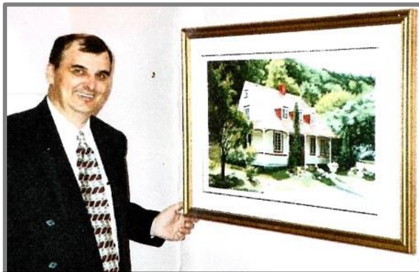
Devant un tableau de La maison natale de Louis Fréchette