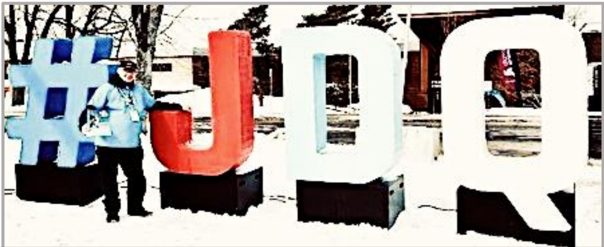
Participation comme bénévole au Hockey féminin et patinage de vitesse devant le logo des Jeux du Québec 2023 à Rivière-du-Loup